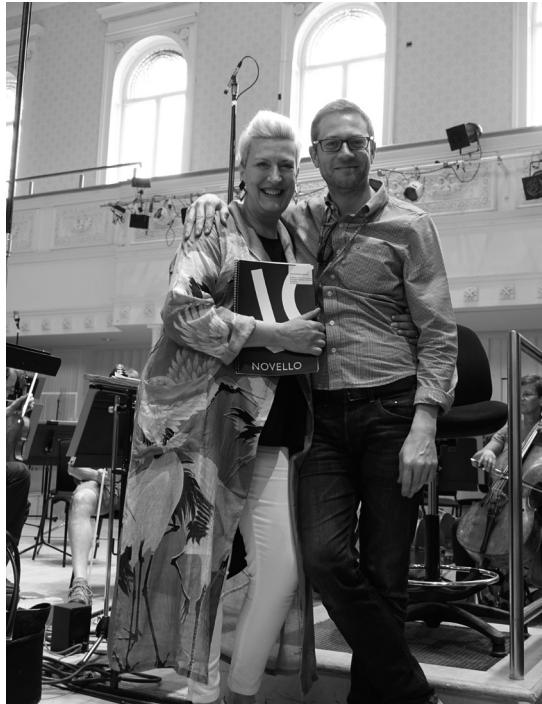
Dame Sarah Connolly and John Wilson during the recording sessions