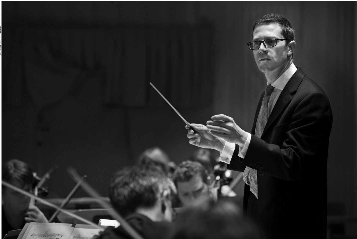
BBC Scottish Symphony Orchestra and its Associate Guest Conductor, John Wilson, March 2017