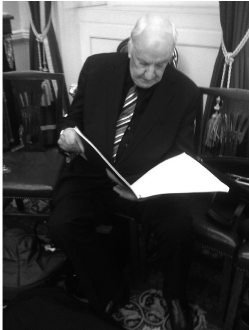
Dame Sarah Connolly