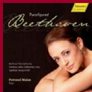
TRANSFIGURED BEETHOVEN Transcriptions by Friedman, Heller, Kalkbrenner, Seiss, Sgambati, Tausig & Raff CD No.: 98.286