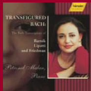
TRANSFIGURED BACH Transcriptions by Bartók, Lipatti & Friedman CD No.: 98.424