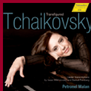
TRANSFIGURED TCHAIKOVSKY Transcriptions by Miknovsky & Feinberg CD No.: 98.640