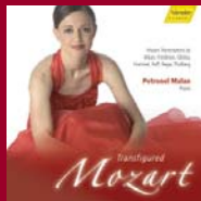
TRANSFIGURED MOZART Transcriptions by Alkan, Friedman, Glinka, Hummel, Raff, Reger & Thalberg CD No.: 98.231