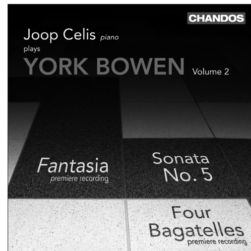
Bowen Works for Piano, Volume 2 CHAN 10410