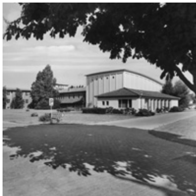
Der Sendesaal in den 60er Jahren