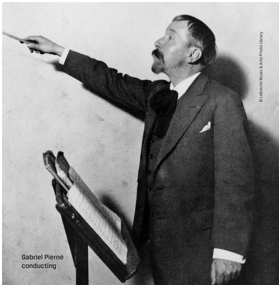
Gabriel Pierné conducting