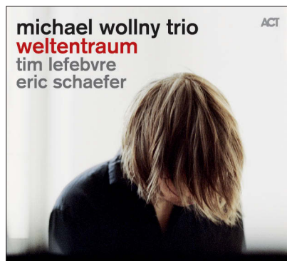
weltraum ACT 9563-2