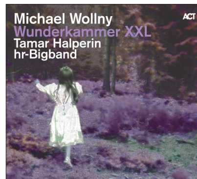
wunderkammer XXL ACT 6011-2