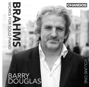
Brahms Works for Solo Piano, Volume 1 CHAN 10716