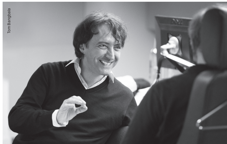
Jean-Efflam Bavouzet during the recording sessions