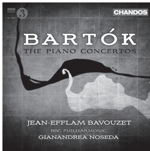
Bartók The Piano Concertos CHAN 10610