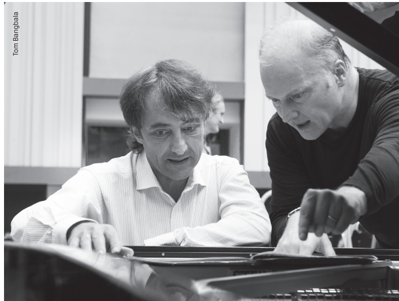
Jean-Efflam Bavouzet and Gianandrea Noseda during the recording sessions

and Bartók. An extensive survey of the music of Italian composers of the twentieth century includes recordings of works by Respighi, Dallapiccola, Wolf-Ferrari, Petrassi, and Casella.