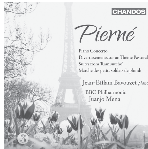
Pierné Piano Concerto • Divertissements sur un Thème Pastoral Suites from 'Ramuntcho' • Marche des petits soldats de plomb CHAN 10633