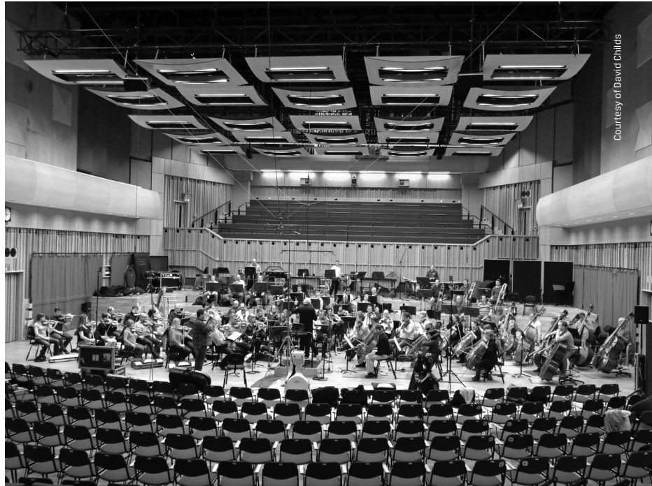
From the recording sessions