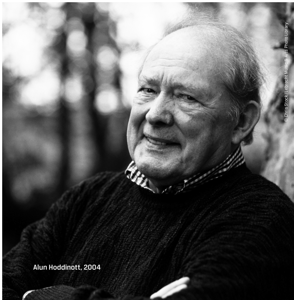
Alun Hoddinott, 2004