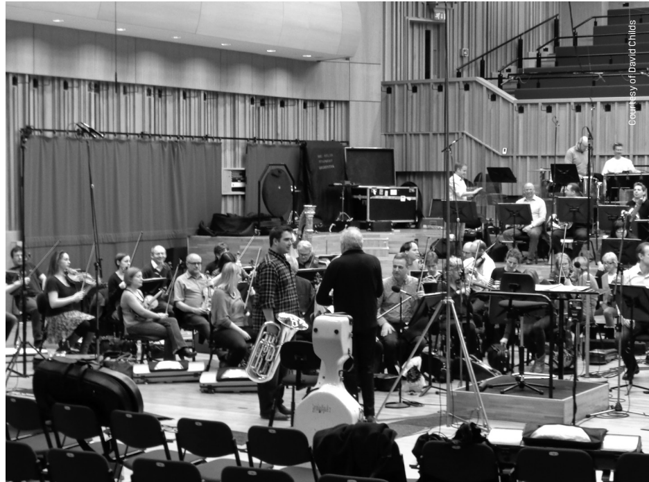
From the recording sessions