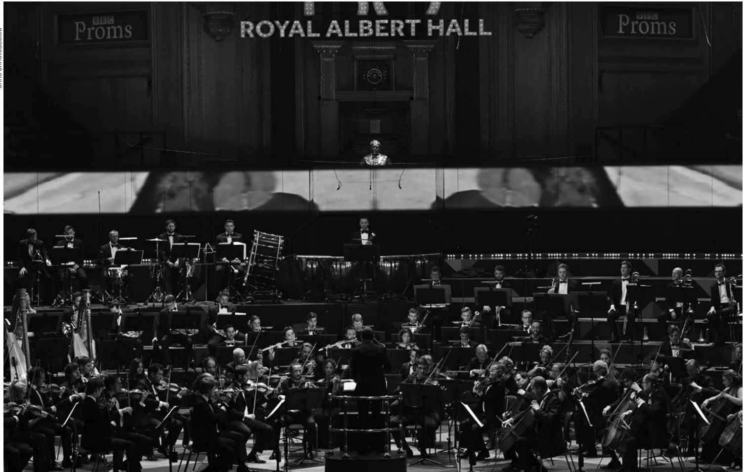
Sinfonia of London and John Wilson, at the BBC Proms, 4 September 2021