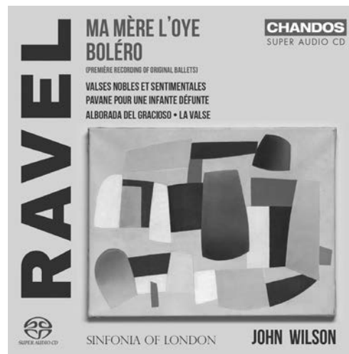
Ravel Ma Mère L'Oye • Boléro and other works CHSA 5280