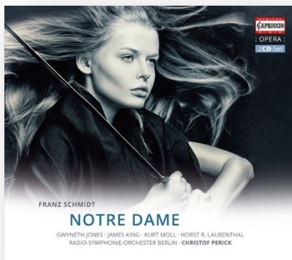
FRANZ SCHMIDT Notre Dame (complete) 2CD · C5181