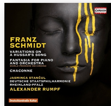
FRANZ SCHMIDT Orchestral Works Piano Fantasia C5274