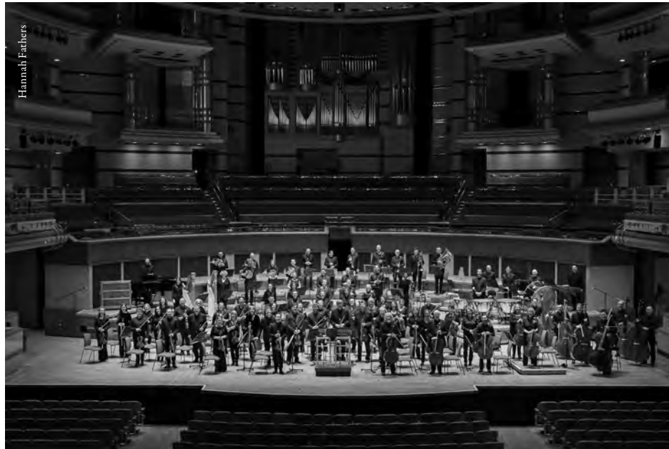
City of Birmingham Symphony Orchestra, in rehearsal, February 2022