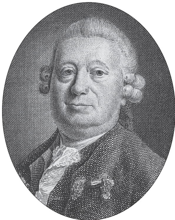
Johann Heinrich Rolle