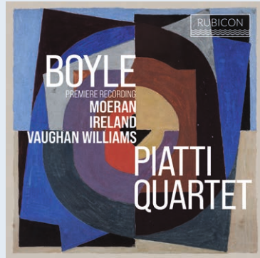
Boyle · Moeran Ireland · Vaughan Williams Piatti Quartet RCD1098