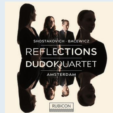
Reflections Shostakovich · Bacewicz Dudok Quartet RCD1099