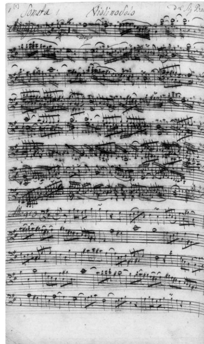
Autograph score of the Sonata in B minor, BWV 1014 (violin part)

LEILA SCHAYEGH & JÖRG HALUBEK traduit par Sylvie Coquillat