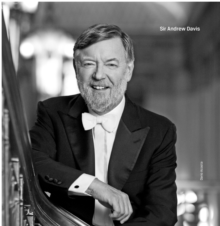
Sir Andrew Davis