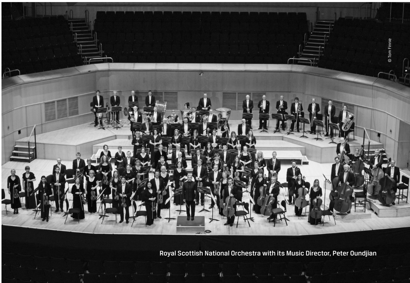
Royal Scottish National Orchestra with its Music Director, Peter Oundjian

le répertoire symphonique et lyrique de base, il est un grand partisan des œuvres du vingtième siècle de compositeurs tels Janáček, Messiaen, Boulez, Elgar, Tippett et Britten. Il a donné des concerts avec le BBC Symphony Orchestra aux Proms de la BBC et en tournée à Hong-Kong, au Japon, aux États-Unis et en Europe. Il a dirigé tous les plus grands orchestres du monde, ainsi que des productions dans des théâtres lyriques et festivals du monde entier, notamment au Metropolitan Opera de New York, au Teatro alla Scala de Milan et au Festival de Bayreuth. Maestro Davis enregistre de manière prolifique; il est actuellement sous contrat d'exclusivité chez Chandos. Il a reçu la Charles Heidsieck Music Award de la Royal Philharmonic Society en 1991, a été fait commandeur de l'Ordre de l'Empire britannique en 1992, et en 1999 Knight Bachelor au titre des distinctions honorifiques décernées par la reine à l'occasion de la nouvelle année. www.sirandrewdavis.com