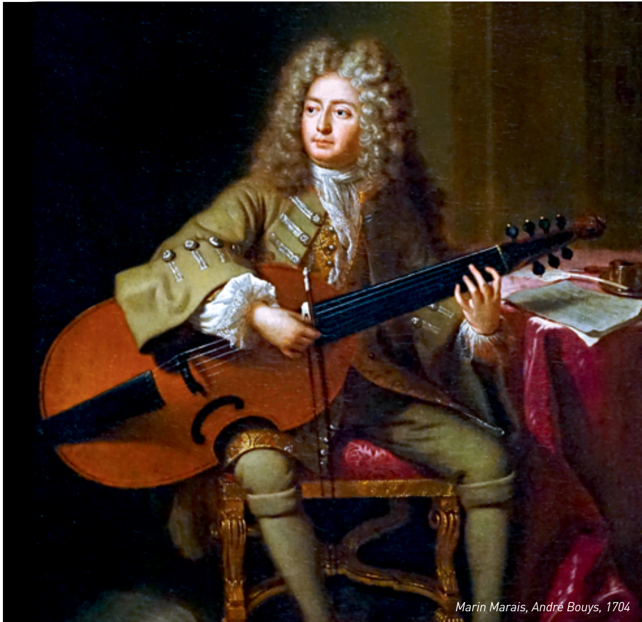
Marin Marais, André Bouys, 1704