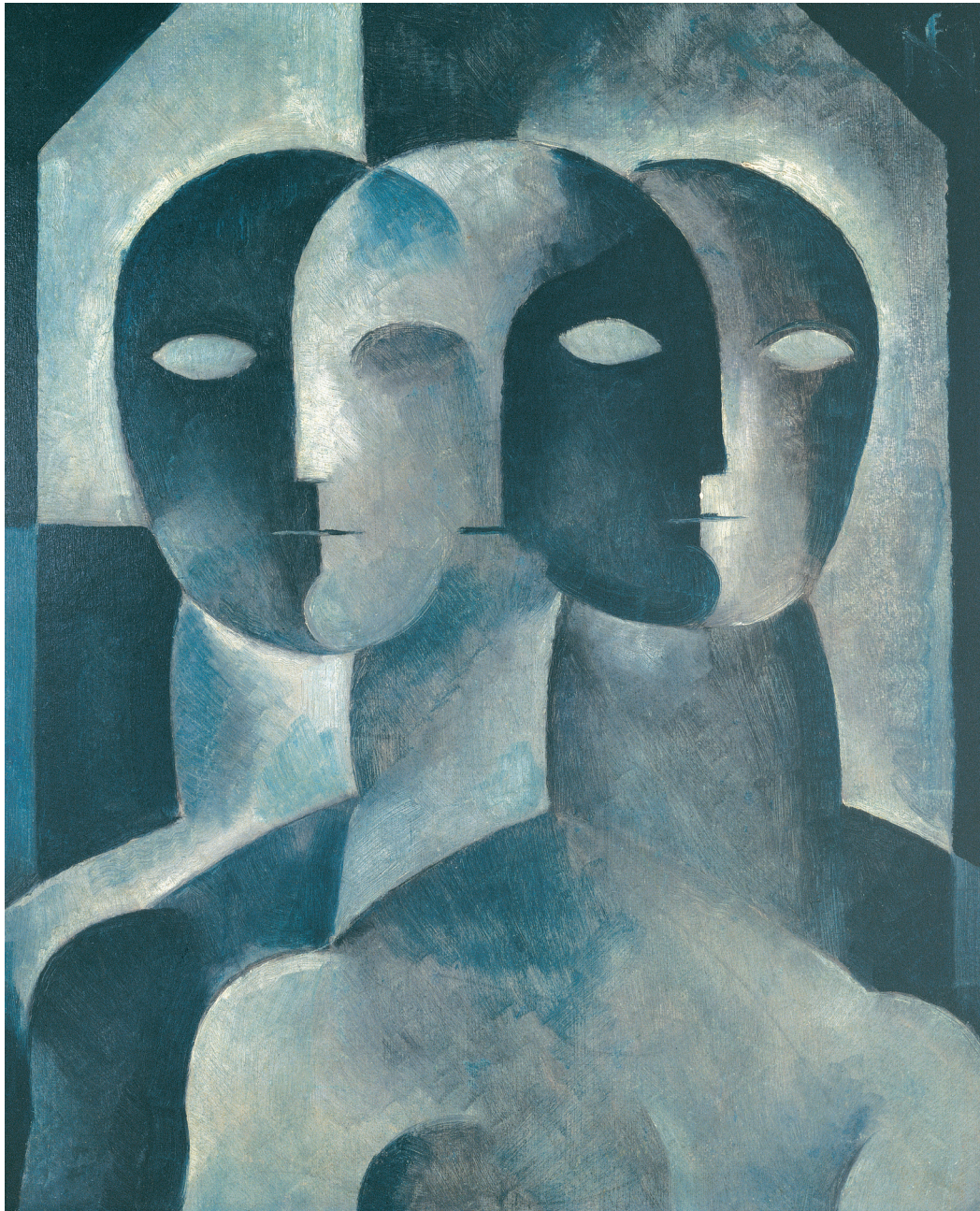
Nós (Rio, c. 1926 / Óleo/cartão / 45.5 x 37.5 cm) by Ismael Nery (1900–1934)