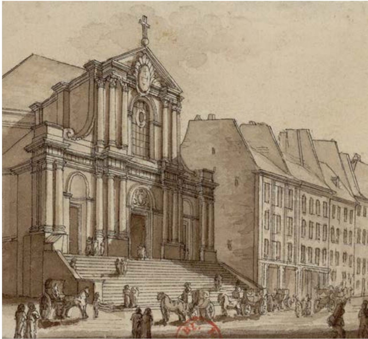
Église Saint-Roch, dessinée par Santi, ca 1820