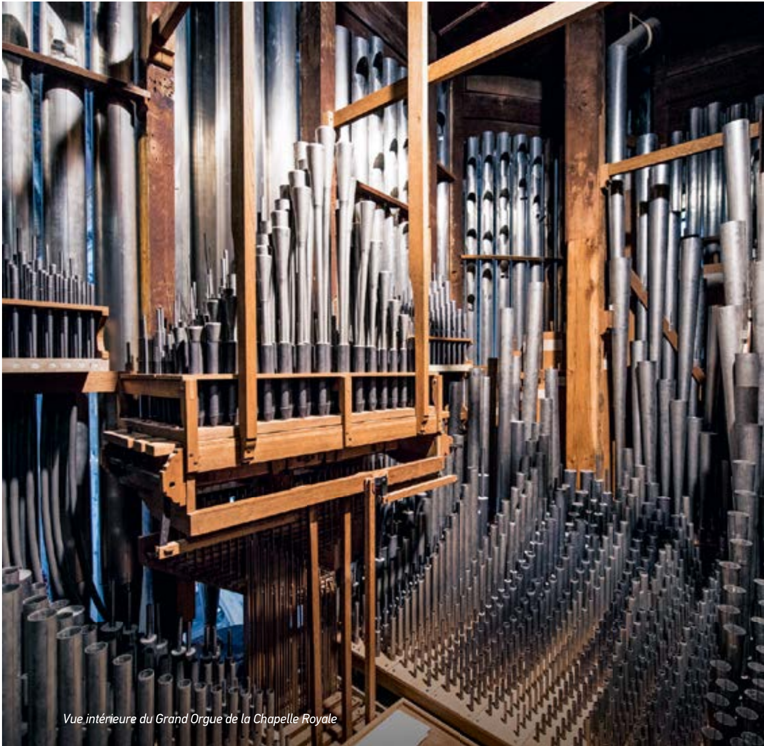
Vue intérieure du Grand Orgue de la Chapelle Royale