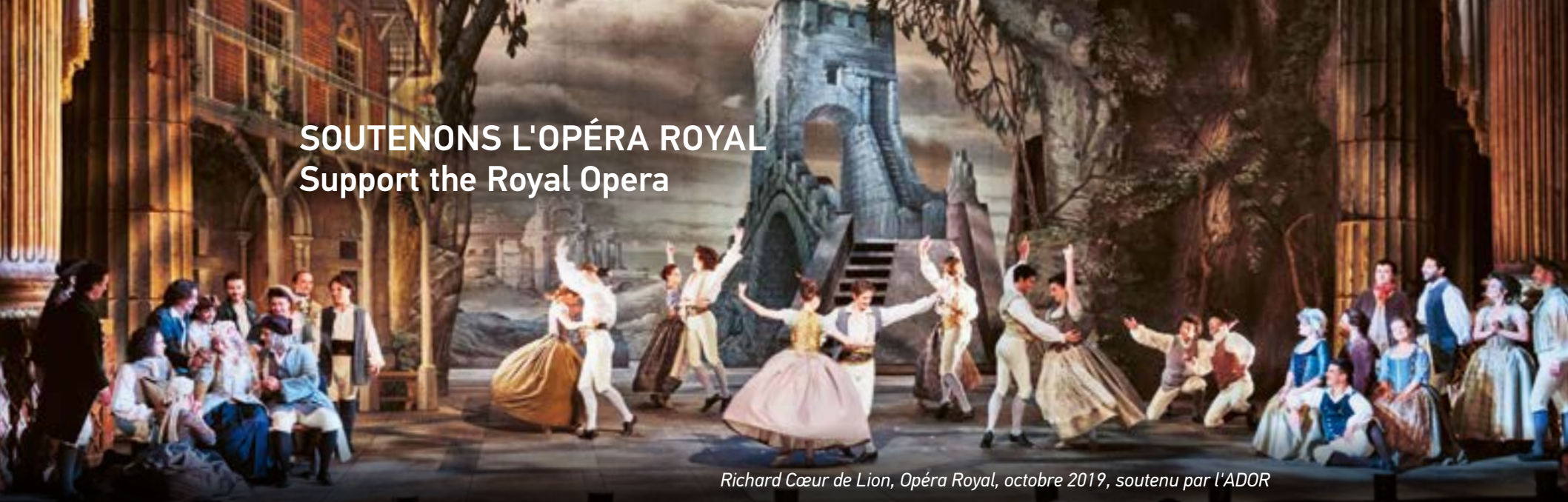
Richard Cœur de Lion, Opéra Royal, octobre 2019, soutenu par l'ADOR

Château de Versailles Spectacles, filiale privée du Château de Versailles, a pour mission de perpétuer le foisonnement musical et artistique qui fait rayonner la résidence royale dans le monde entier. Elle produit la saison musicale de l'Opéra Royal, soit près d'une centaine de représentations par an à l'Opéra Royal et à la Chapelle Royale, des concerts d'exception au Salon d'Hercule et dans la Galerie des Glaces ainsi que les grands spectacles de plein air à l'Orangerie. Elle ne reçoit aucune subvention publique. Ses recettes de billetterie et le soutien de donateurs privés et d'entreprises mécènes lui permettent de construire une saison riche qui réunit plus de 50 000 spectateurs par an.