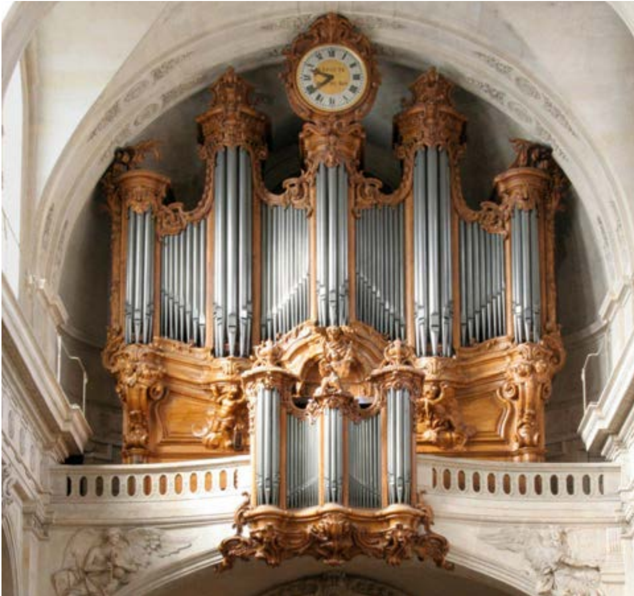
Grand Orgue Clicquot à l'église Saint-Roch, Paris