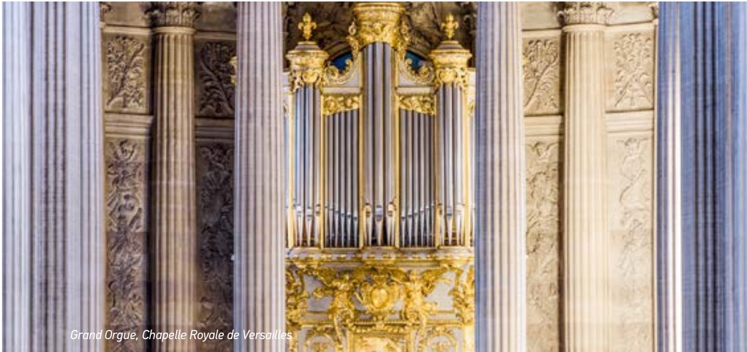
Grand Orgue, Chapelle Royale de Versailles