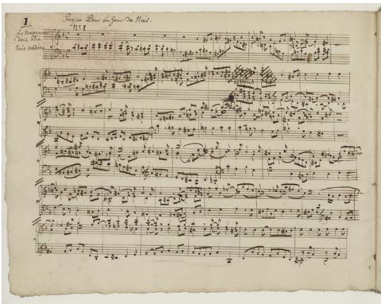
Fugue pour le jour de Noël, partition autographe, 1823