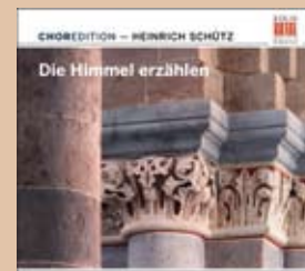
Die Himmel erzählen Heinrich Schütz · 0300152BC