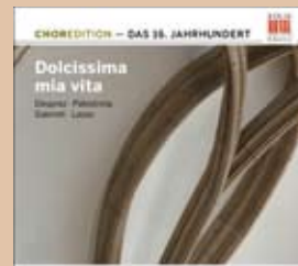
Dolcissima mia vita Das 16. Jahrhundert · 0300147BC