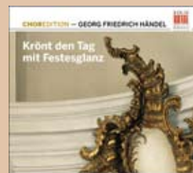
Krönt den Tag mit Festesglanz Georg Friedrich Händel · 0300154BC