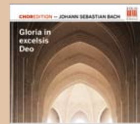
Gloria in excelsis Deo Johann Sebastian Bach · 0300153BC