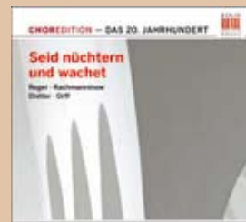
Seid nüchtern und wachet Das 20. Jahrhundert · 0300151BC