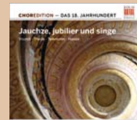
Jauchze, jubilier und singe Das 18. Jahrhundert · 0300149BC