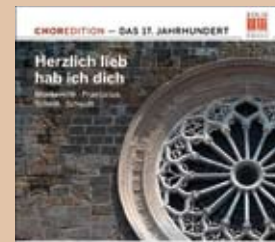
Herzlich lieb hab ich dich Das 17. Jahrhundert · 0300148BC