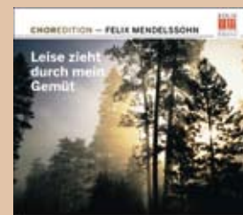
Leise zieht durch mein Gemüt Felix Mendelssohn · 0300155BC