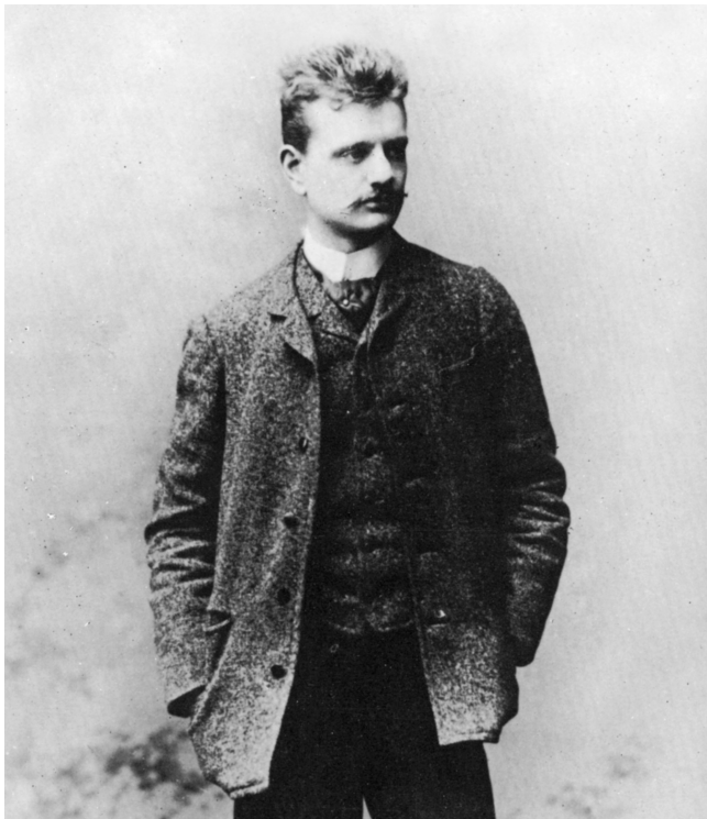
Jean Sibelius as a student in Vienna