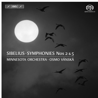
SIBELIUS: SYMPHONIES NOS 2 & 5 MINNESOTA ORCHESTRA / OSMO VÄNSKÄ BIS-1986 SACD

Excellentia Pizzicato Recording of the Month MusicWeb International 5 Diapasons Diapason