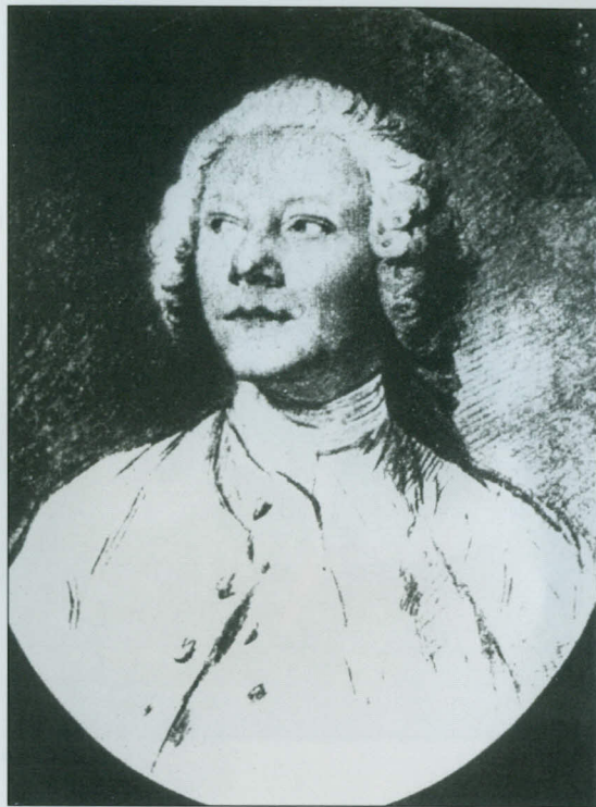
Josef Mysliveček (Georg Friedrich Schmidt)

Already available: cpo 777 050-2 »First Class Performances« (American Record Guide 6/05)