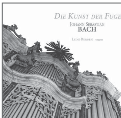
Johann Sebastian Bach Die Kunst der Fuge RAM 1106