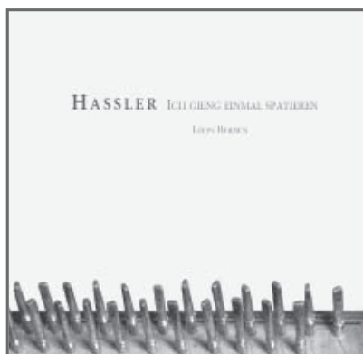
Hassler Ich gieng einmal spatieren RAM 0501