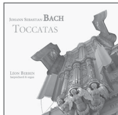
Johann Sebastian Bach Toccatas RAM 0903