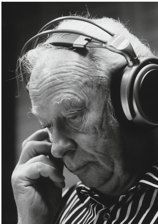
Aulis Sallinen