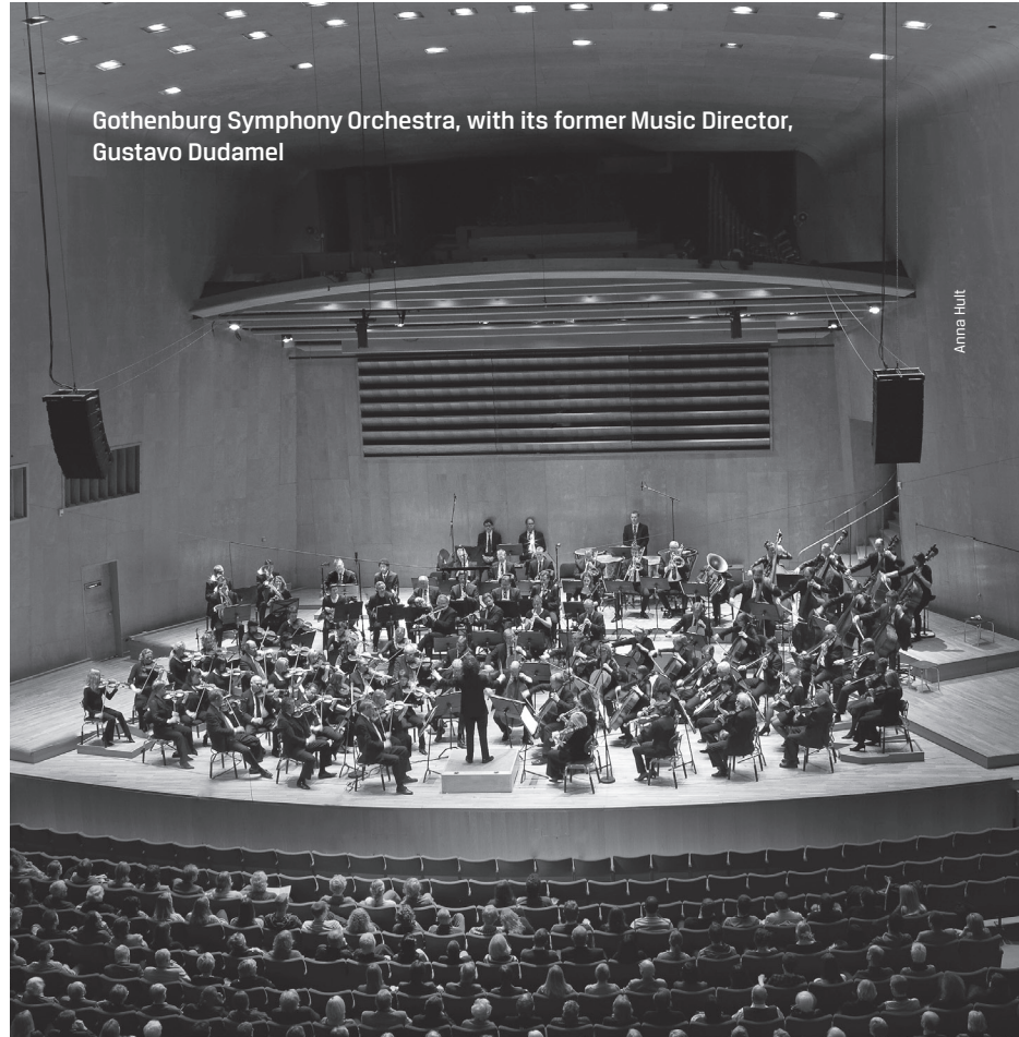
Gothenburg Symphony Orchestra, with its former Music Director, Gustavo Dudamel