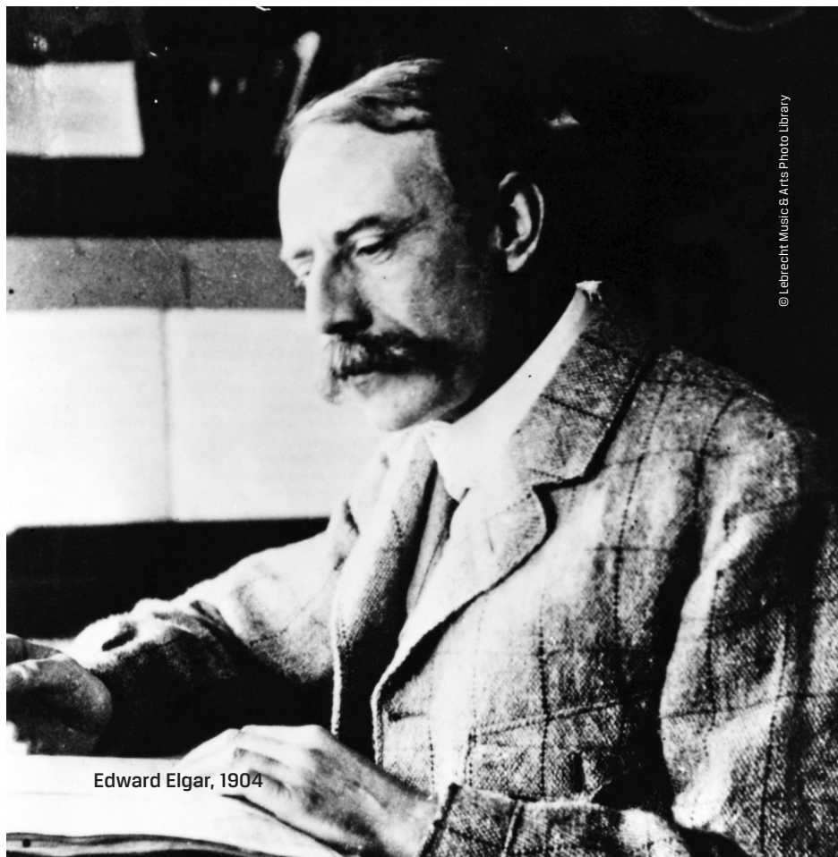
Edward Elgar, 1904