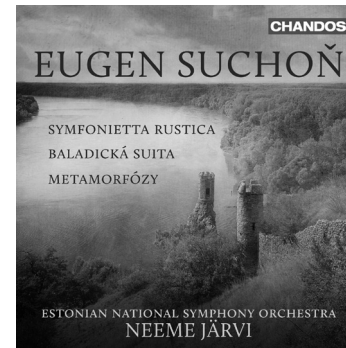
Suchoň Symfonietta rustica • Baladická suita Metamorfózy CHAN 10849