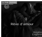
Rêve d'amour MIR9955