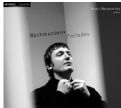
Rachmaninov préluces MIR004