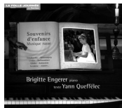
Souvenirs d'enfance russe MIR022