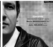
Chopin concertos MIR047