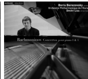
Rachmaninov concertos 1&4 MIR019