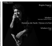
Hymne à la nuit MIR043