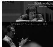
Rachmaninov concertos 2&3 MIR008