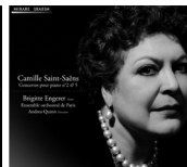
Saint-Saëns concertos 2 & 5 MIR079

Translation / Charles Johnston Übersetzung / Corinne Fonseca