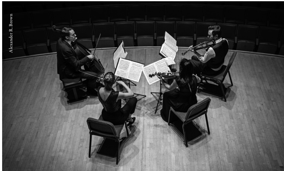
Doric String Quartet in performance at the Perelman Theater, Kimmel Center, in Philadelphia, Pennsylvania, at a concert in February 2020 promoted by the Philadelphia Chamber Music Society

© 2022 Bayan Northcott Traduction: Marie-Sella Paris