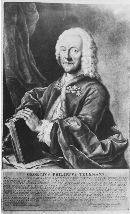
Engraving by Valentin Daniel Preisler (1717–1765), now at the Universitätsbibliothek Leipzig, after lost painting by Ludwig Michael Schneider (c. 1710–1781)