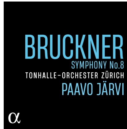
ALPHA 987 [Symphony No.7 also available ALPHA 932]