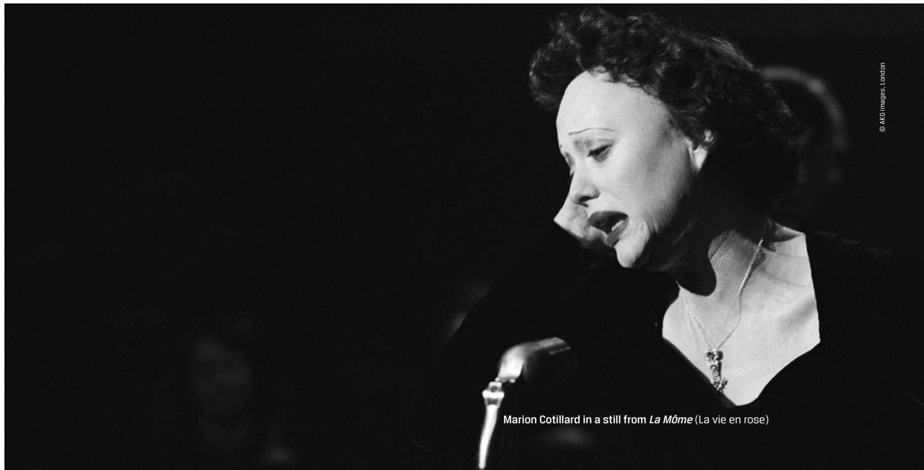
Marion Cotillard in a still from La Môme (La vie en rose)