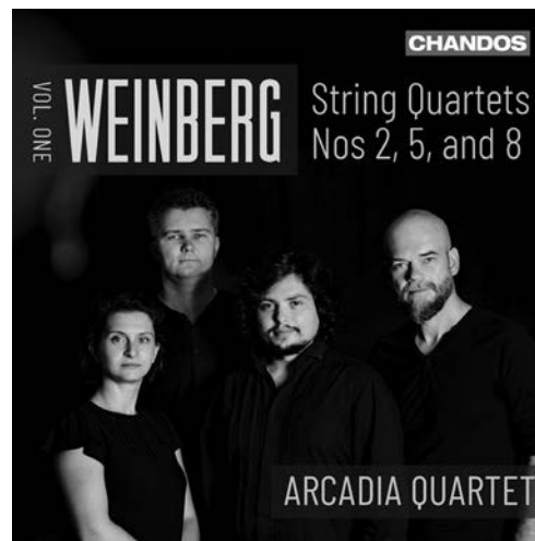
Weinberg String Quartets, Volume 1 CHAN 20158