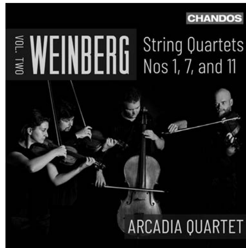
Weinberg String Quartets, Volume 2 CHAN 20174