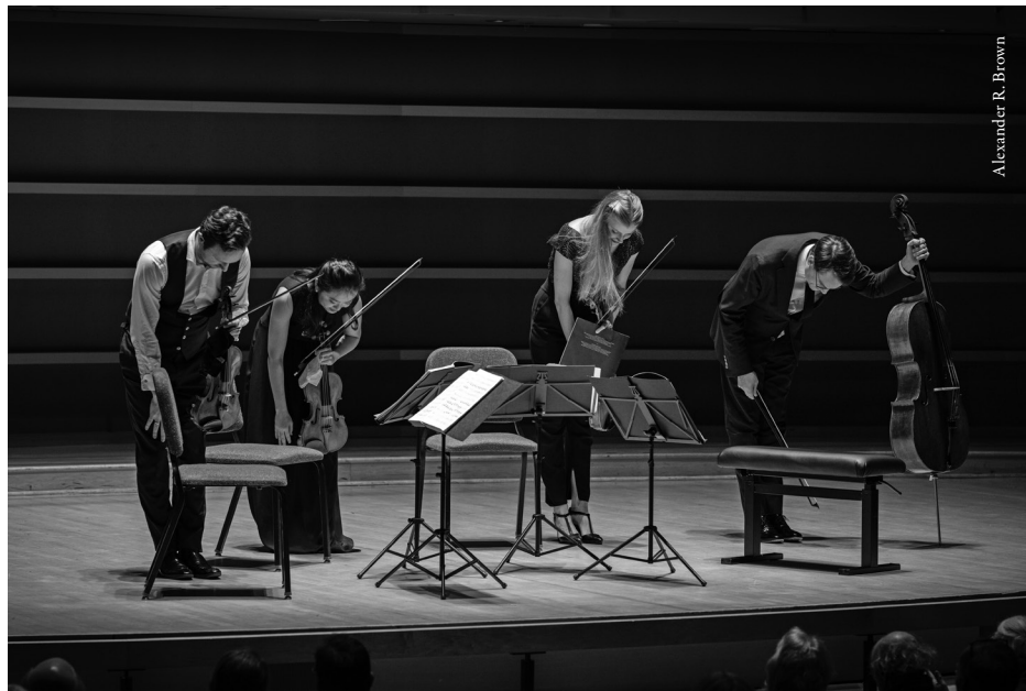
Doric String Quartet in performance at the Perelman Theater, Kimmel Center, in Philadelphia, Pennsylvania, at a concert in February 2020 promoted by the Philadelphia Chamber Music Society