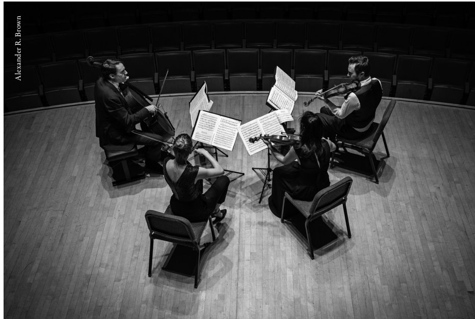
Doric String Quartet in performance at the Perelman Theater, Kimmel Center, in Philadelphia, Pennsylvania, at a concert in February 2020 promoted by the Philadelphia Chamber Music Society