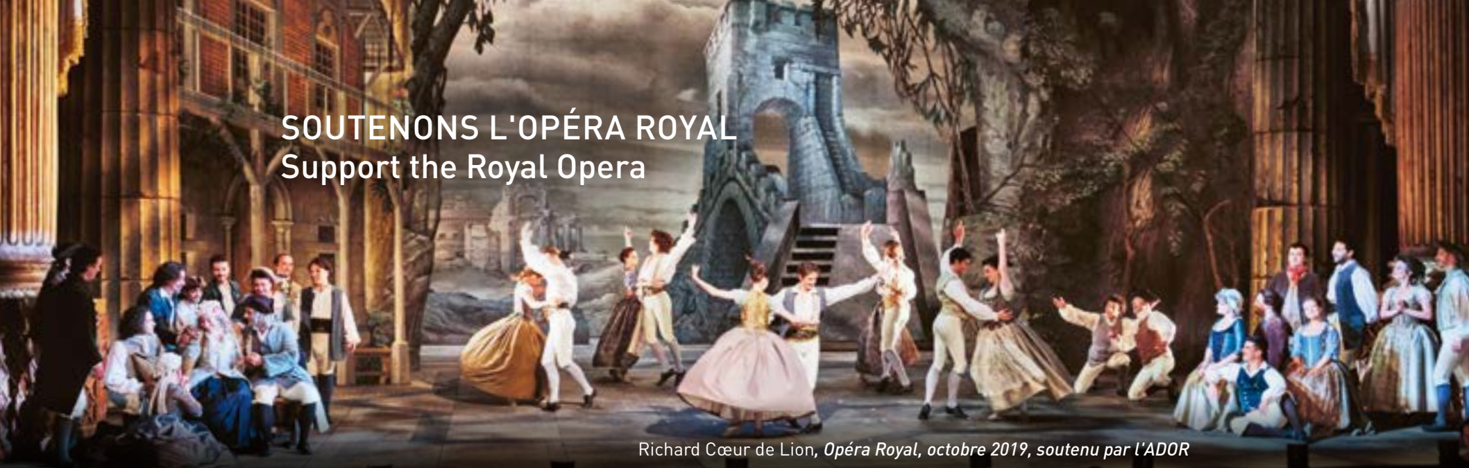
Richard Cœur de Lion, Opéra Royal, octobre 2019, soutenu par l'ADOR

Château de Versailles Spectacles, filiale privée du Château de Versailles, a pour mission de perpétuer le foisonnement musical et artistique qui fait rayonner la résidence royale dans le monde entier. Elle produit la saison musicale de l'Opéra Royal, soit près d'une centaine de représentations par an à l'Opéra Royal et à la Chapelle Royale, des concerts d'exception au Salon d'Hercule et dans la Galerie des Glaces ainsi que les grands spectacles de plein air à l'Orangerie. Elle ne reçoit aucune subvention publique. Ses recettes de billetterie et le soutien de donateurs privés et d'entreprises mécènes lui permettent de construire une saison riche qui réunit plus de 50 000 spectateurs par an.