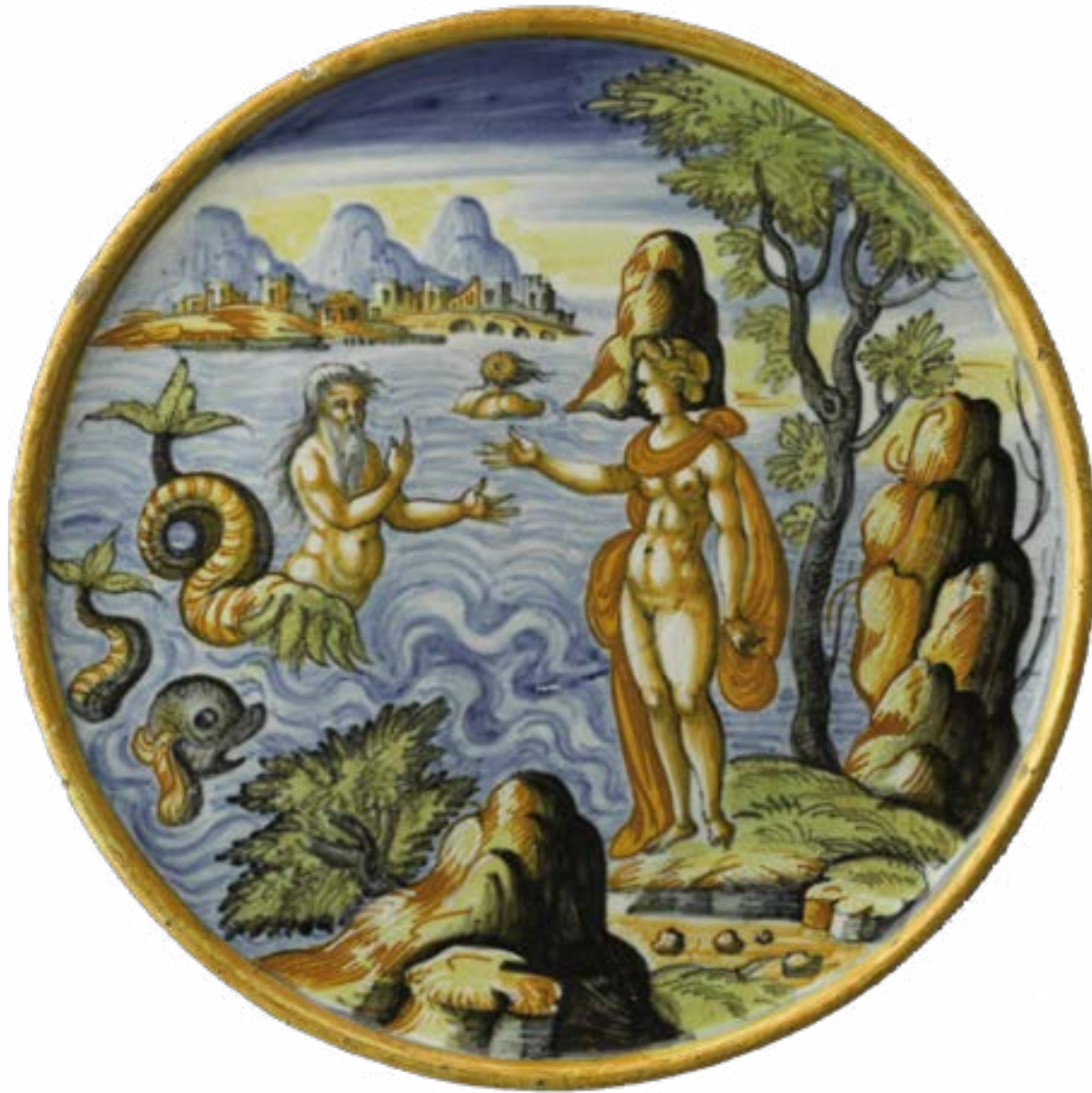
Scylla & Glaucus, plateau rond en faïence de Nevers dans le goût de la majolique italienne, 1641.