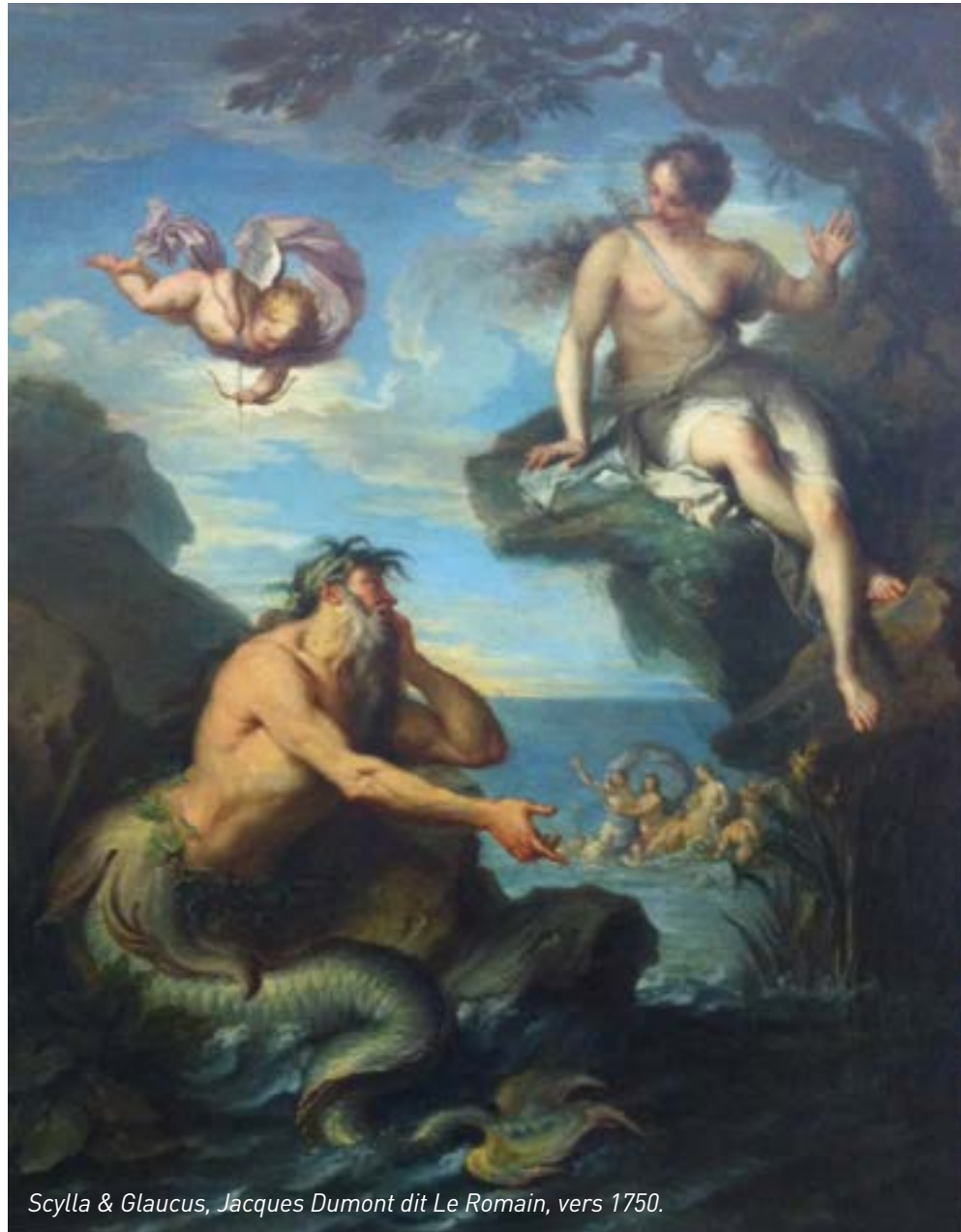
Scylla & Glaucus, Jacques Dumont dit Le Romain, vers 1750.