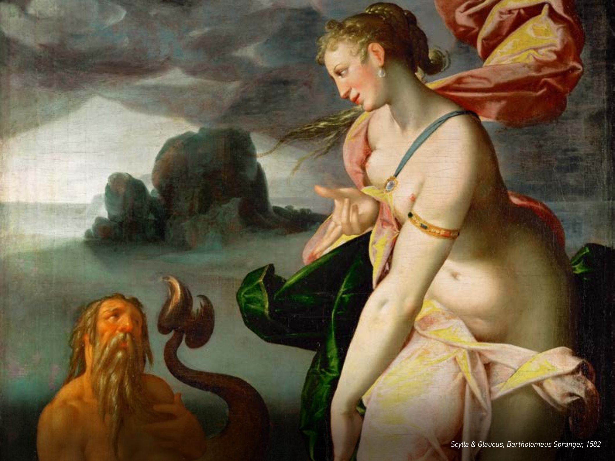
Scylla & Glaucus, Bartholomeus Spranger, 1582