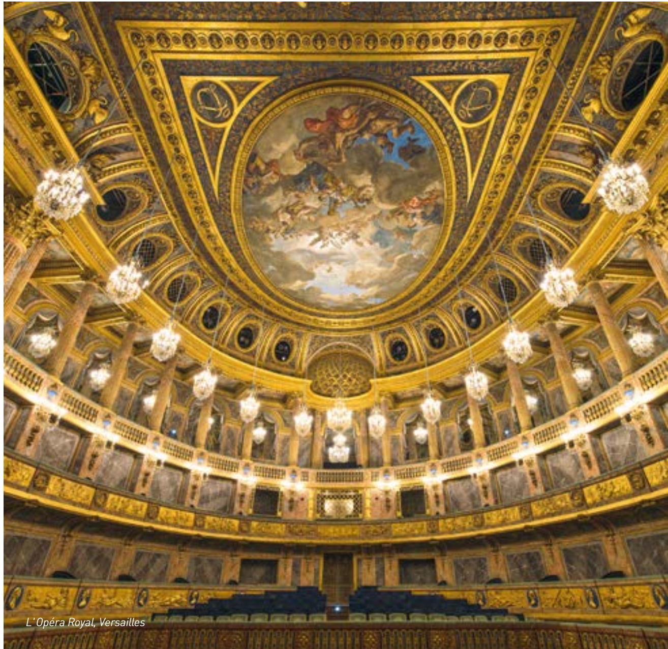
L'Opéra Royal, Versailles