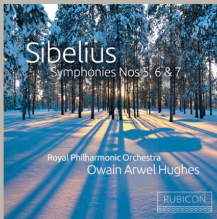
Sibelius: Symphonies 5, 6 & 7 RPO / Owain Arwel Hughes RCD1073