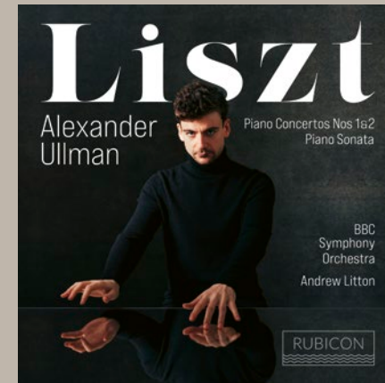
Liszt: Piano Concertos 1 & 2, Sonata Alexander Ullman RCD1057