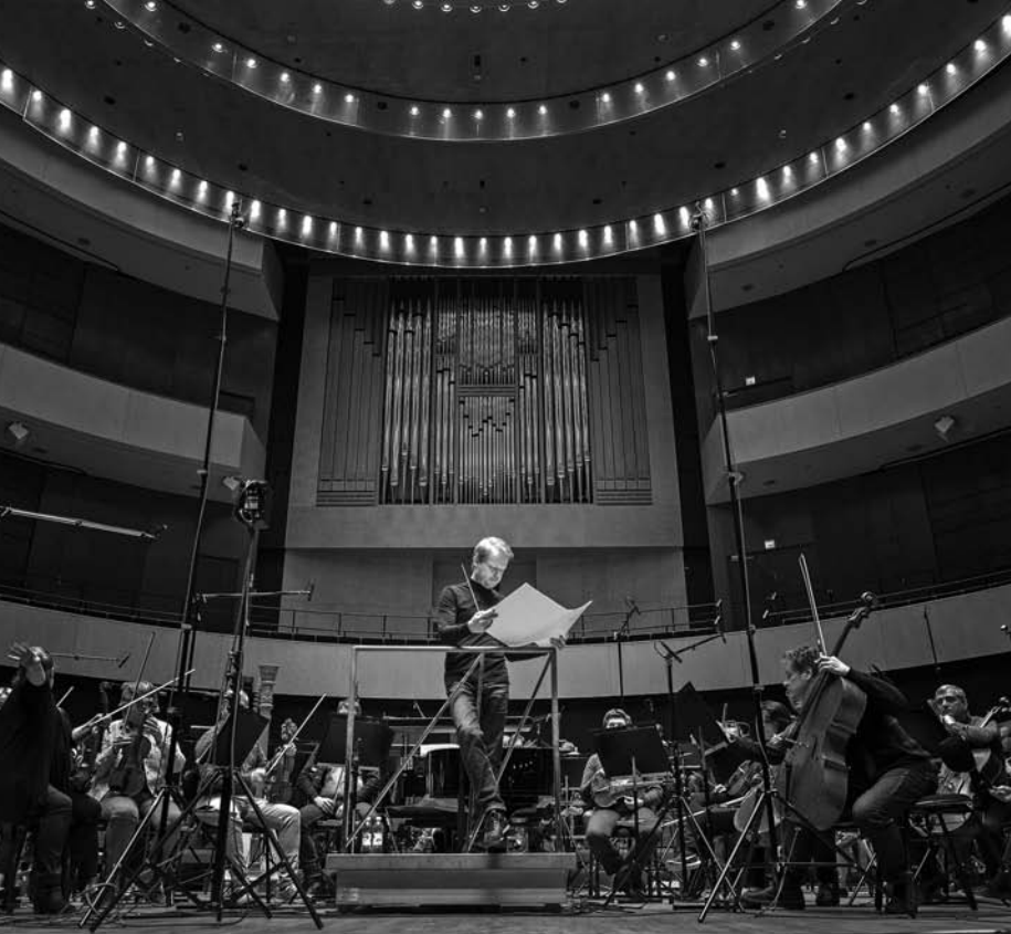
JAAKKO KUUSISTO AND THE LAHTI SYMPHONY ORCHESTRA