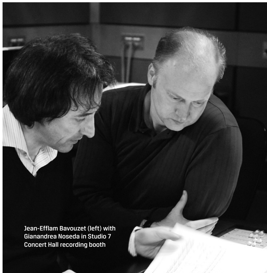
Jean-Efflam Bavouzet (left) with Gianandrea Noseda in Studio 7 Concert Hall recording booth