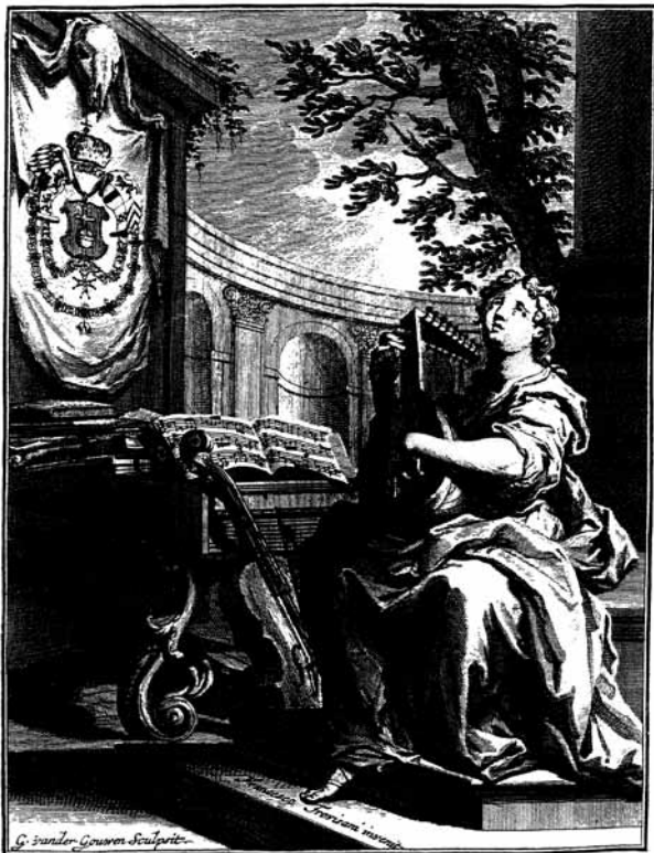
Trvisani : frontispiece for Roger's 1714 Amsterdam edition of Corelli's Concerti Grossi.