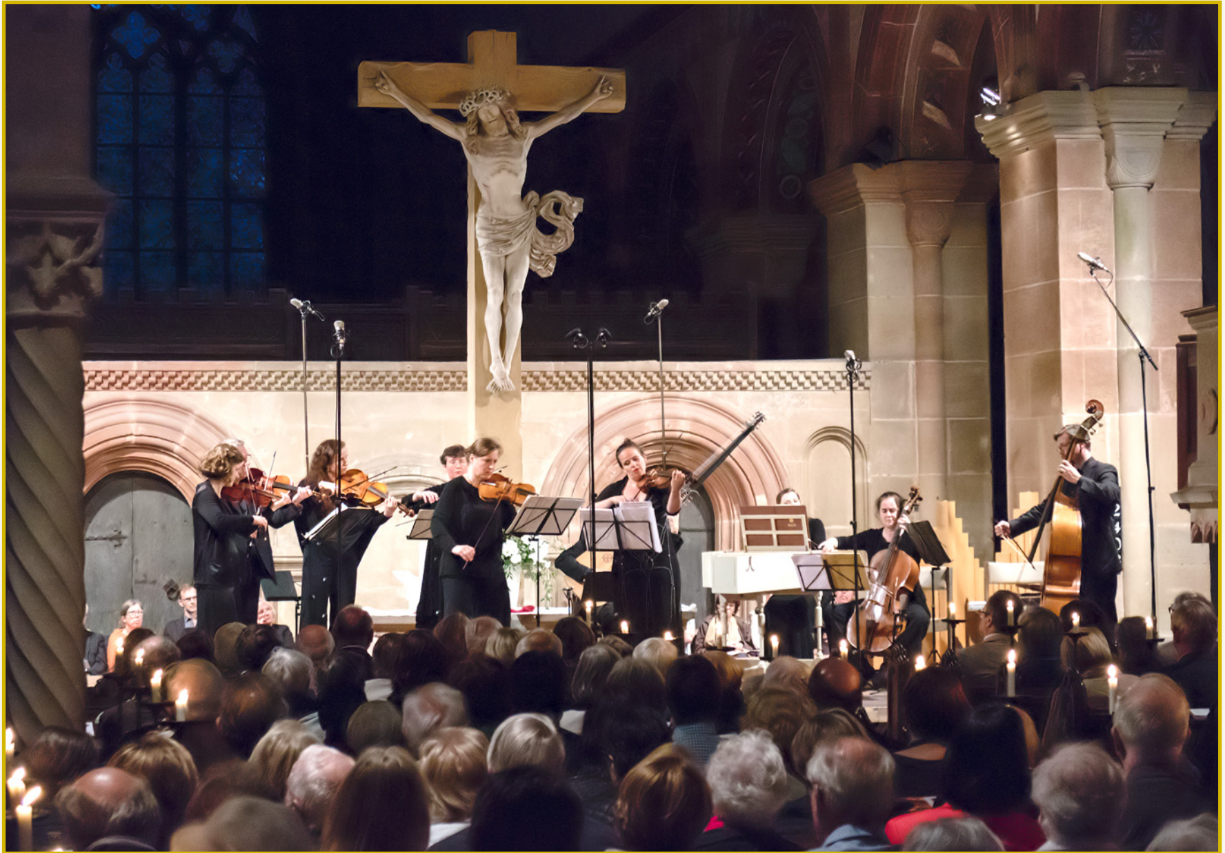
LAUTTEN COMPAGNEY BERLIN ~ JOHANN SEBASTIAN BACH • VIOLIN CONCERTO IN A MINOR, BWV 1041