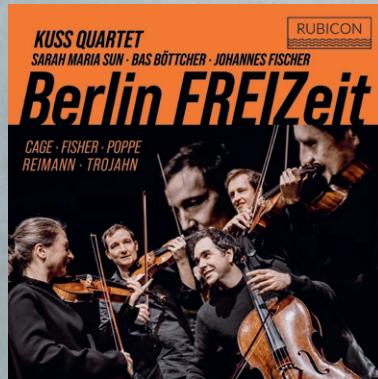
Berlin FREIzeit Kuss Quartet RCD1085