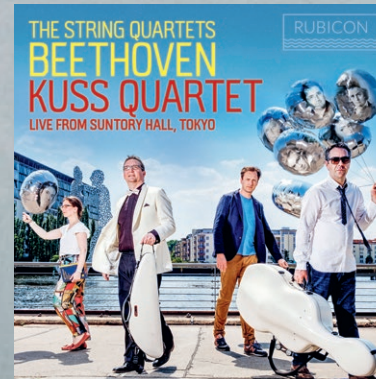
Beethoven: The String Quartets (Vol. 2) Kuss Quartet RCD1045