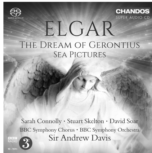
Elgar The Dream of Gerontius • Sea Pictures CHSA 5140(2)