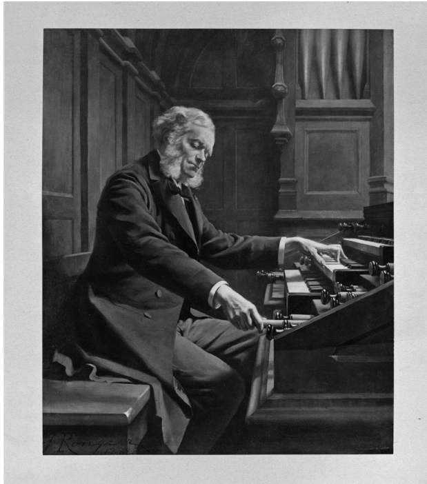
Painting by Jeanne Rongier (1852–1929)