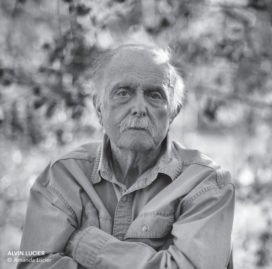
ALVIN LUCIER