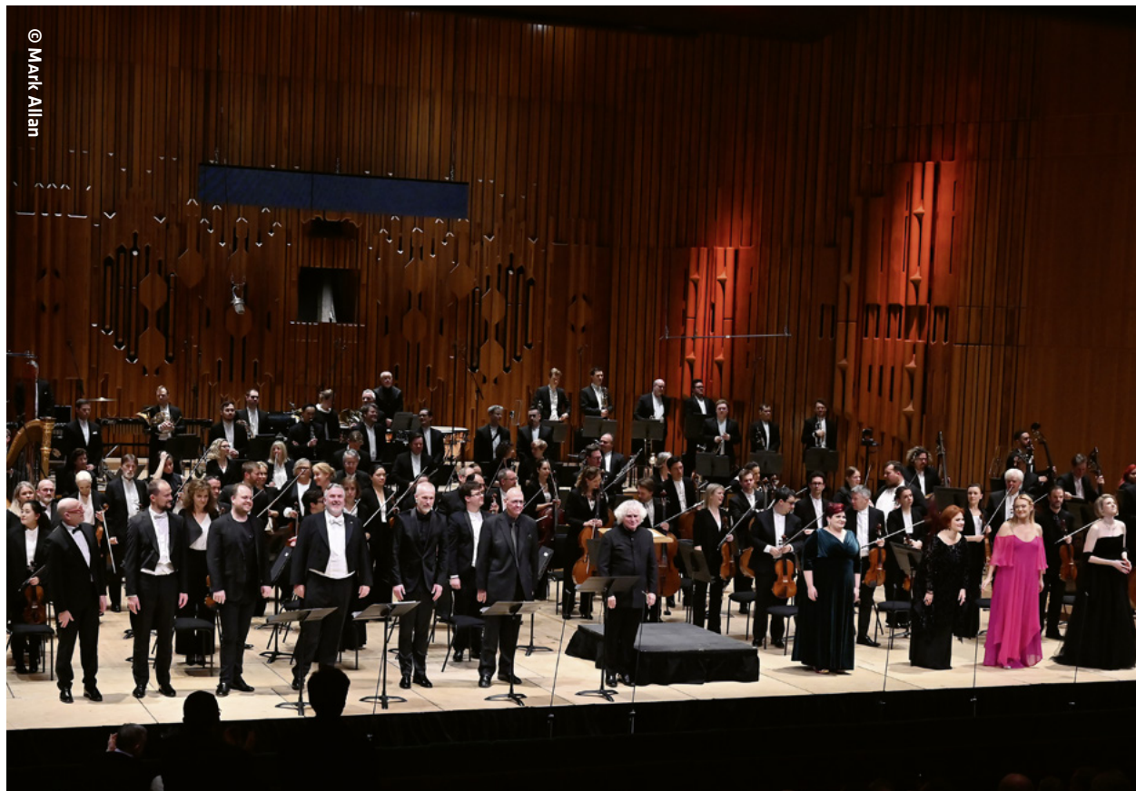
The cast of Katya Kabanova with the London Symphony Orchestra, on stage at the Barbican Hall, following the concert performance on 11 January 2023.

At the front of the stage, from left to right: