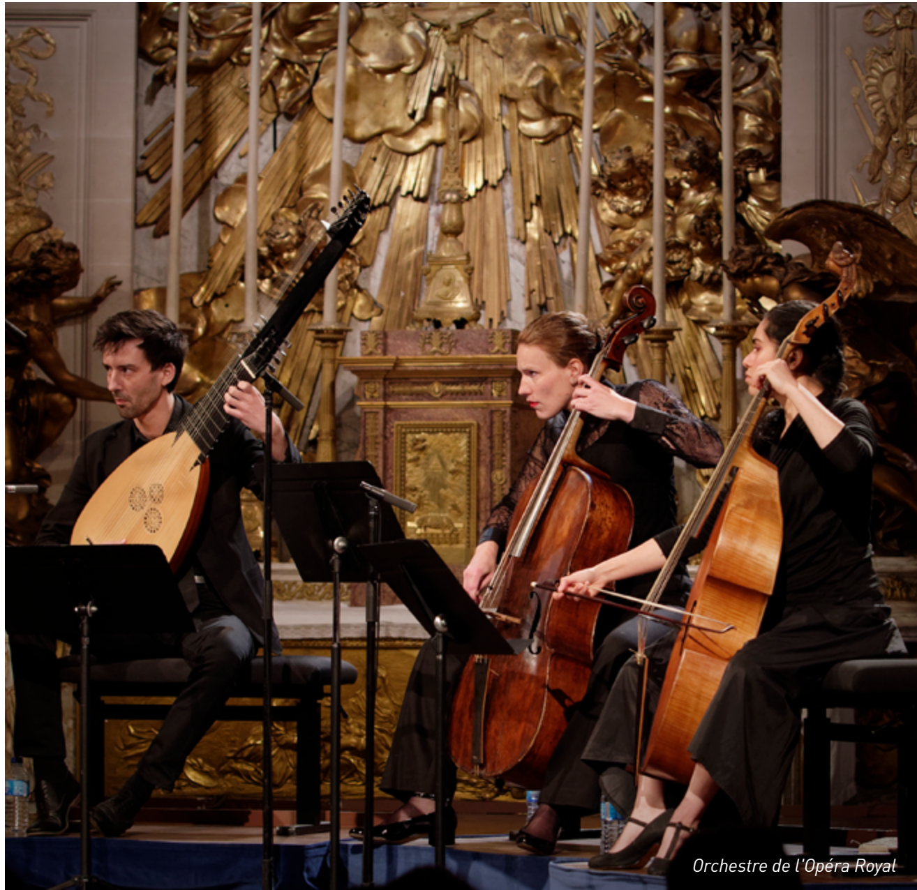
Orchestre de l'Opéra Royal