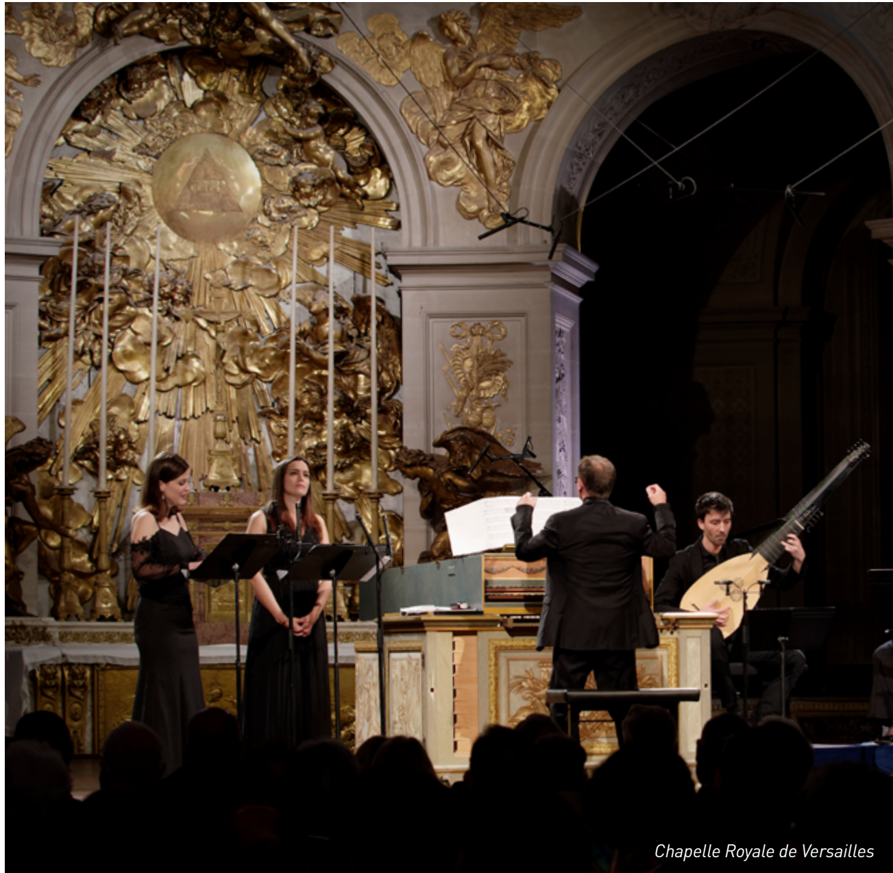
Chapelle Royale de Versailles