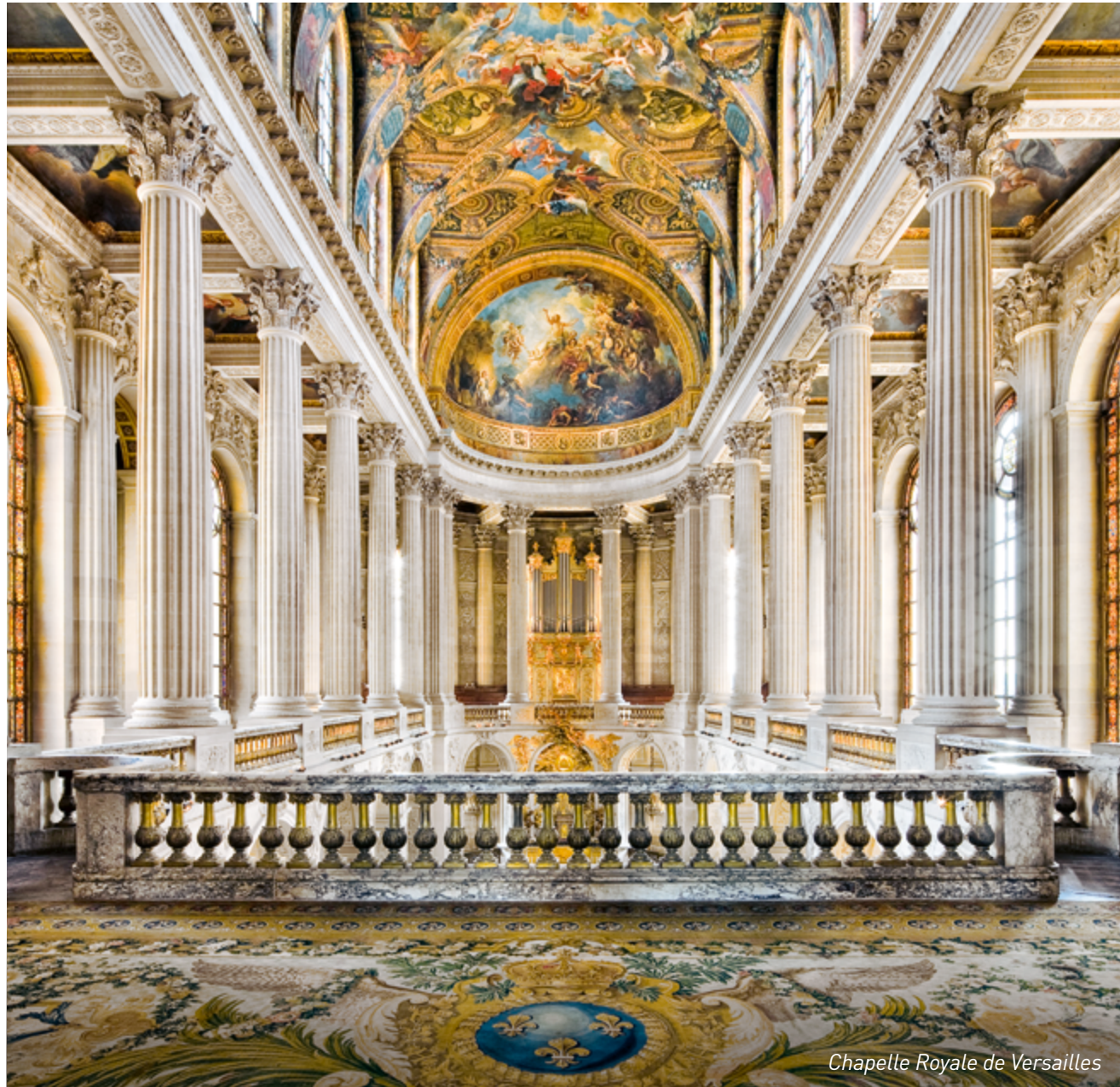
Chapelle Royale de Versailles