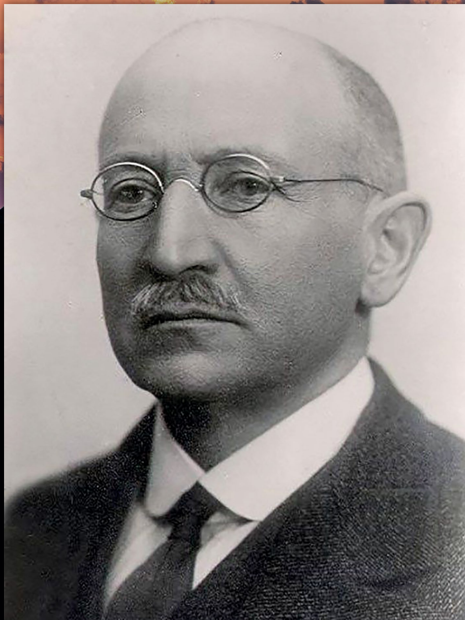
ALEXANDER AFANASYEVICH SPENDIAROV