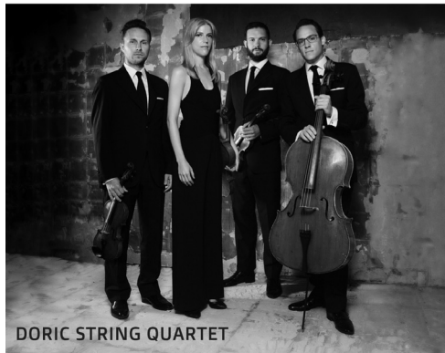
DORIC STRING QUARTET

| String Quartet in G major | String Quartet in C minor 'Quartettsatz'