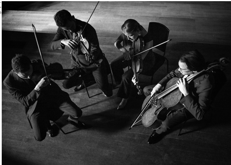
Doric String Quartet