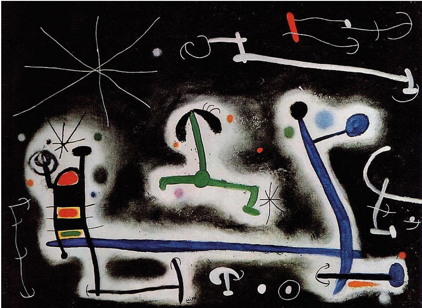
Joan Miró: "Characters and Birds Party for the Night That Is Approaching" (Personatges i ocells de festa per la nit que s'acosta; 1968)