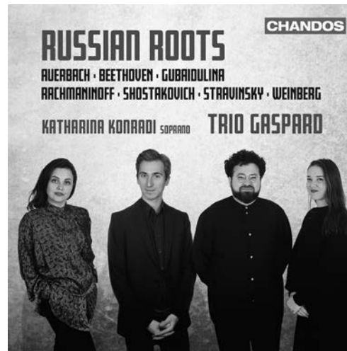
Russian Roots CHAN 20245