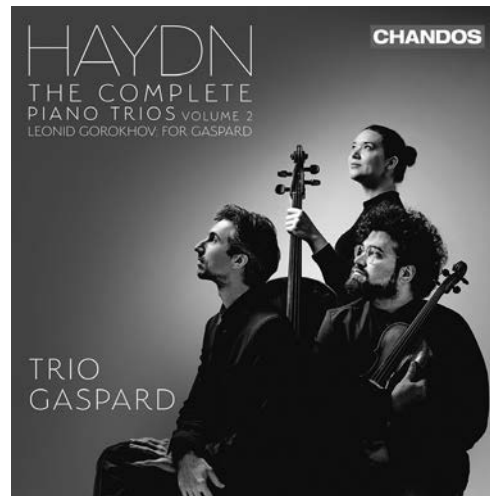
Haydn Complete Piano Trios, Volume 2 CHAN 20270